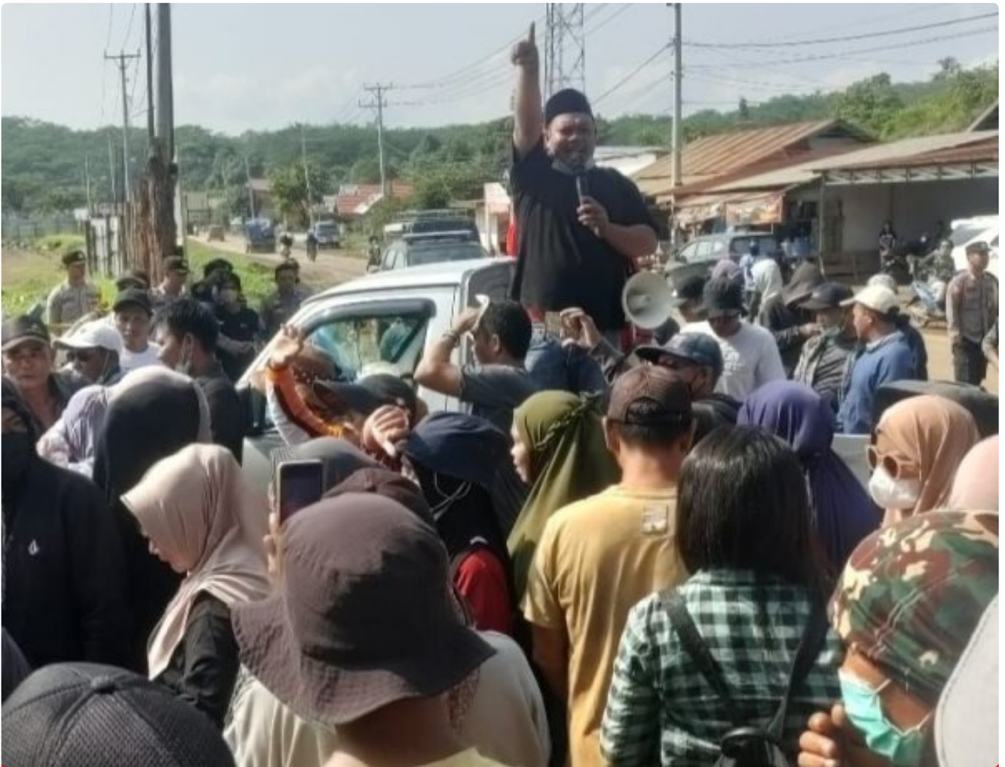
Tampak Korlap Aksi Demo Menyampaikan Orasinya di depan Kantor AFB Desa Lalampu

MOROWALI, Sulawesi Tengah- Tuntutan Aksi Demo yang dilakukan sejumlah warga Desa Lalampu masih menunggu keputusan dari PT Ang and Fang Brother (AFB) perusahaan tambang yang berlokasi di desa tersebut.