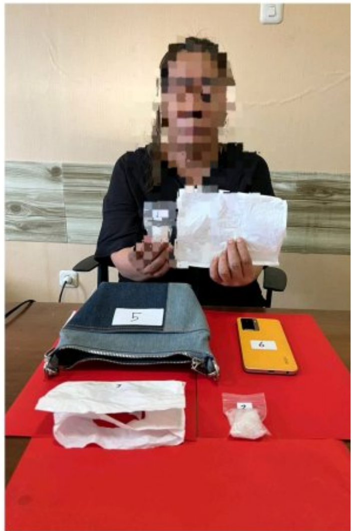
Tampak 2 wanita di tangkap Satreskoba Polres Morowali

MOROWALI, Sulawesi Tengah- Satuan Reserse Narkoba Polres Morowali Polda Sulteng, berhasil mengungkap kasus penyalahgunaan narkotika jenis sabu di Desa Topogaro, Kecamatan Bungku Barat, Kabupaten Morowali Propinsi Sulawesi Tengah (Sulteng), Dalam penggerebekan yang dilakukan pada Minggu