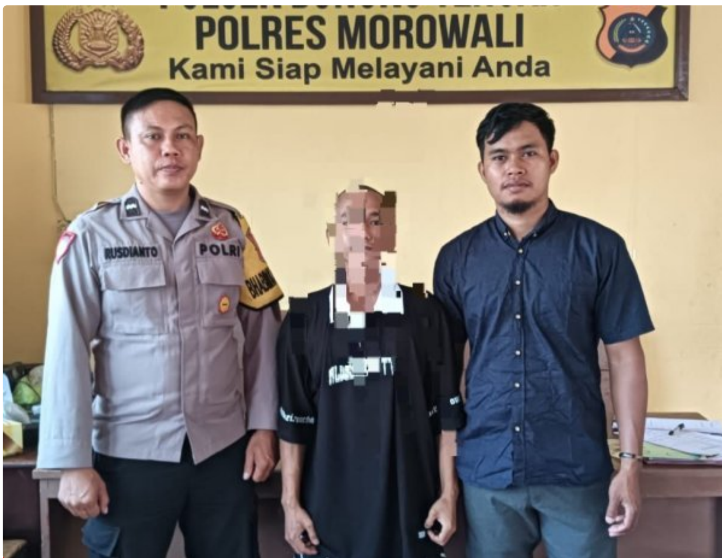
Aparat Polsek Bungku Tengah Berhasil Tangkap Pelaku Curanmor

MOROWALI, Sulawesi Tengah- Pada Hari Sabtu 5 Oktober 2024 Sekitar Pukul 18.30 Wita Kepolisian Sektor (Polsek) Bungku Tengah Polres Morowali, berhasil mengungkap kasus pencurian kendaraan bermotor (curanmor) yang terjadi di Kelurahan Marsaoleh, Kecamatan Bungku Tengah, Kabupaten Morowali,