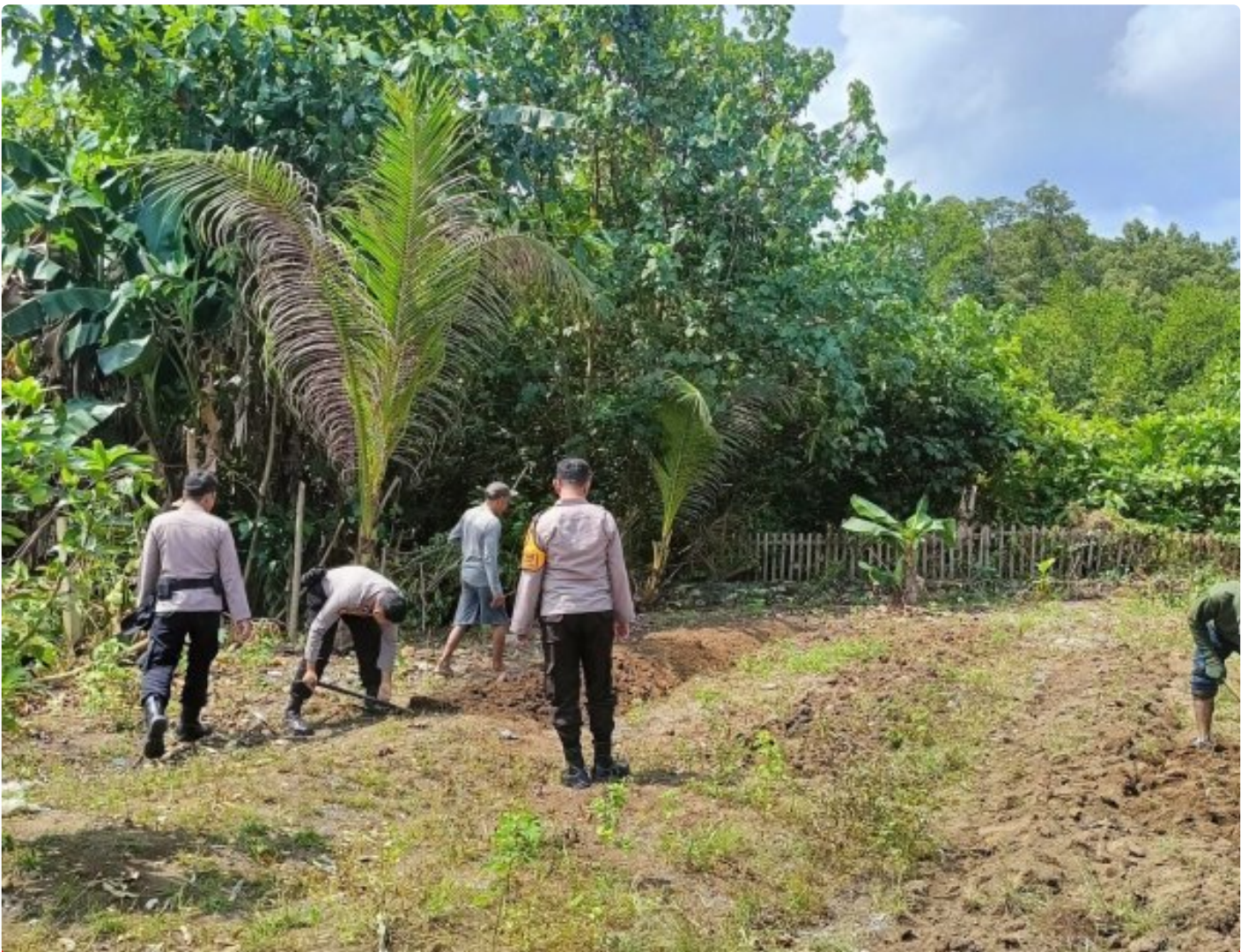
Polsek Bungku Barat kerja bakti pemanfaatan lahan di Desa Wosu

MOROWALI, Sulawesi Tengah- Dalam upaya mendukung program ketahanan pangan nasional, Polsek Bungku Barat mengadakan kegiatan kerja bakti pemanfaatan lahan di area Polsek Bungku Barat, Desa Wosu, Kecamatan Bungku Barat, Kabupaten Morowali, Provinsi Sulawesi Tengah, pada Kamis