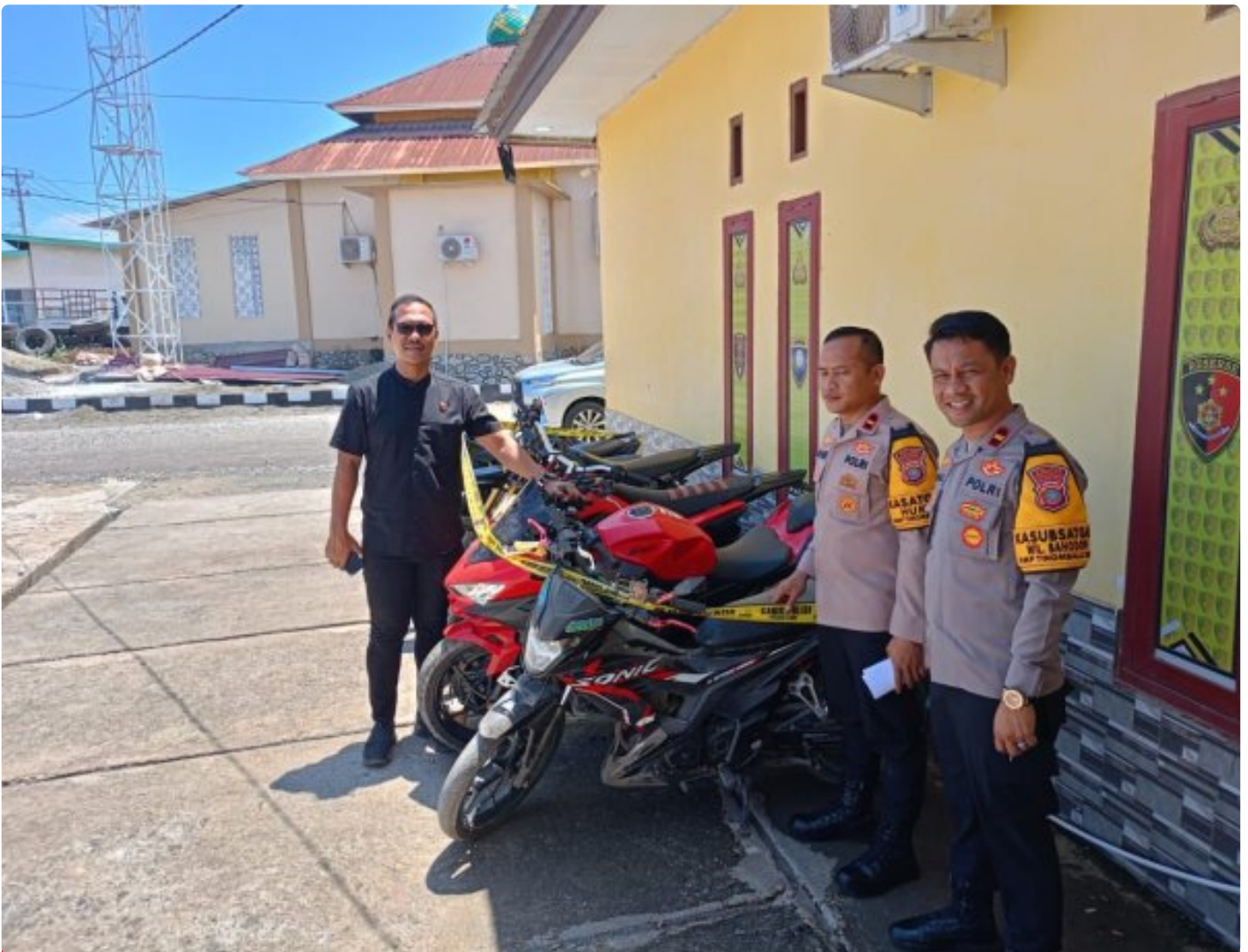
Tampak 6 Unit Sepeda Motor Hasil Curanmor diamankan Polsek Bahodopi

MOROWALI, Sulawesi Tengah- Polsek Bahodopi, Polres Morowali, Polda Sulteng Berhasil Ungkap Pelaku Pencurian Kendaraan Bermotor (Curanmor) dan Pelaku Penadahan Hasil Curian Kendaraan Bermotor yang Terjadi Di Kecamatan Bahodopi, Kabupaten Morowali, Propinsi Sulawesi Tengah.