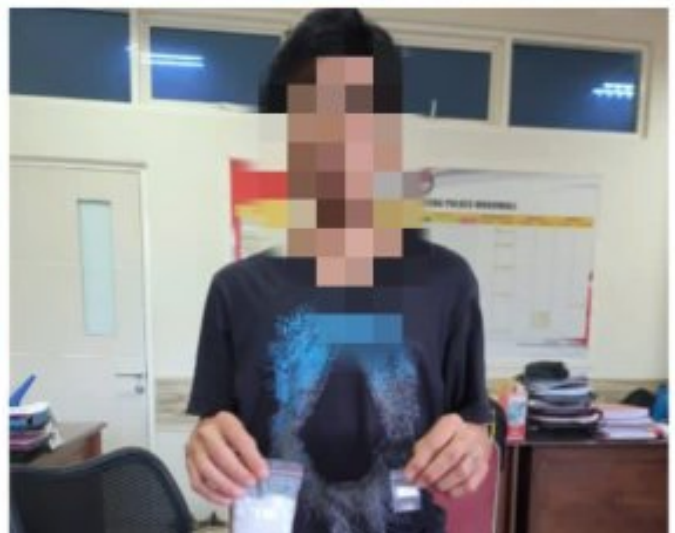
Tsk beserta Babuk di amankan Satresnarkoba Polres Morowali

MOROWALI, Sulawesi Tengah- Polres Morowali berhasil mengungkap serangkaian tindak pidana narkotika yang berhasil dilakukan oleh Satuan Reserse Narkoba (Satresnarkoba) Res Morowali, Pada sejumlah kejadian yang terjadi pada tanggal 26, 27, dan 28 Juli 2023, petugas berhasil menangkap tiga