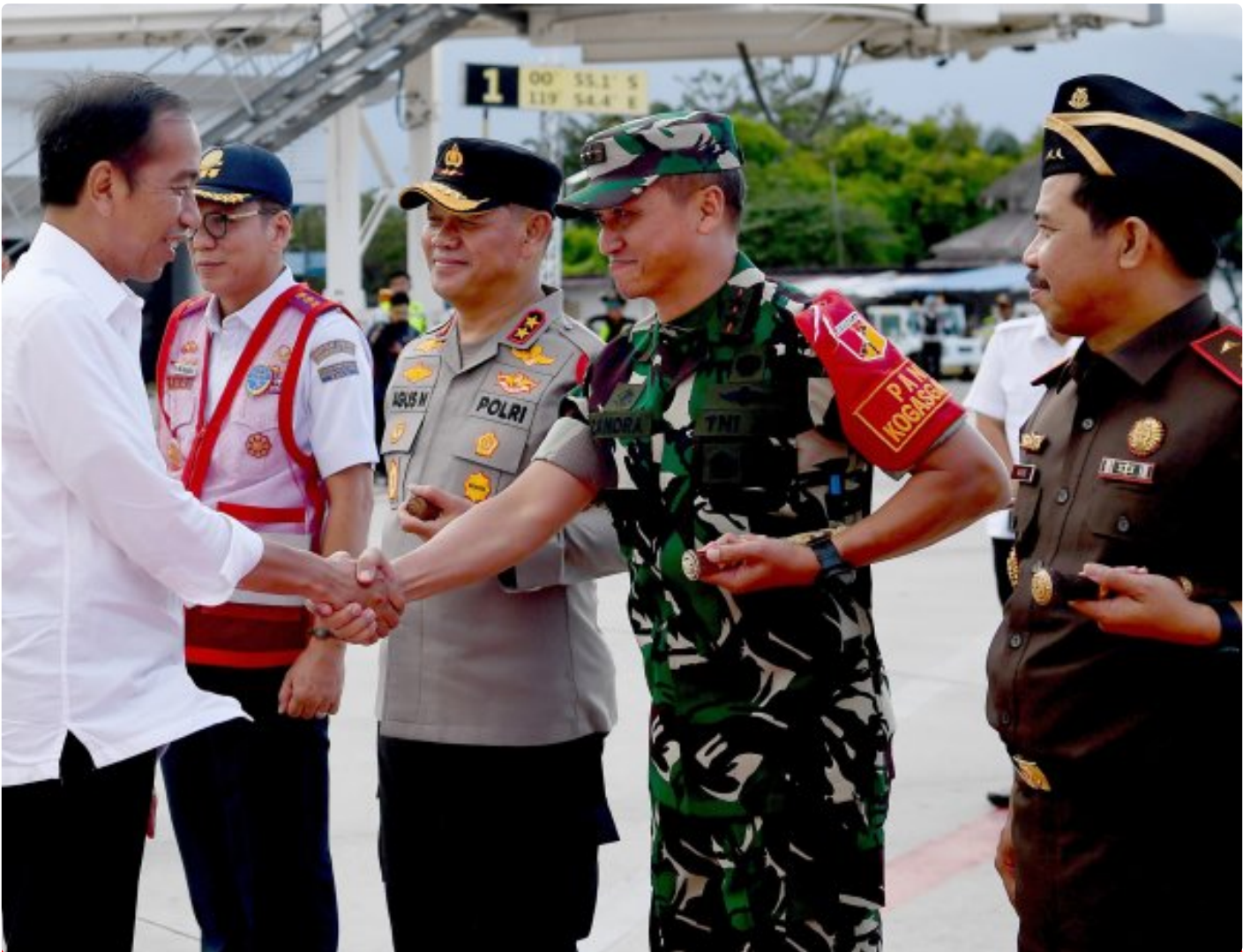
Presiden Jokowi saat hendak bertolak ke Jakarta