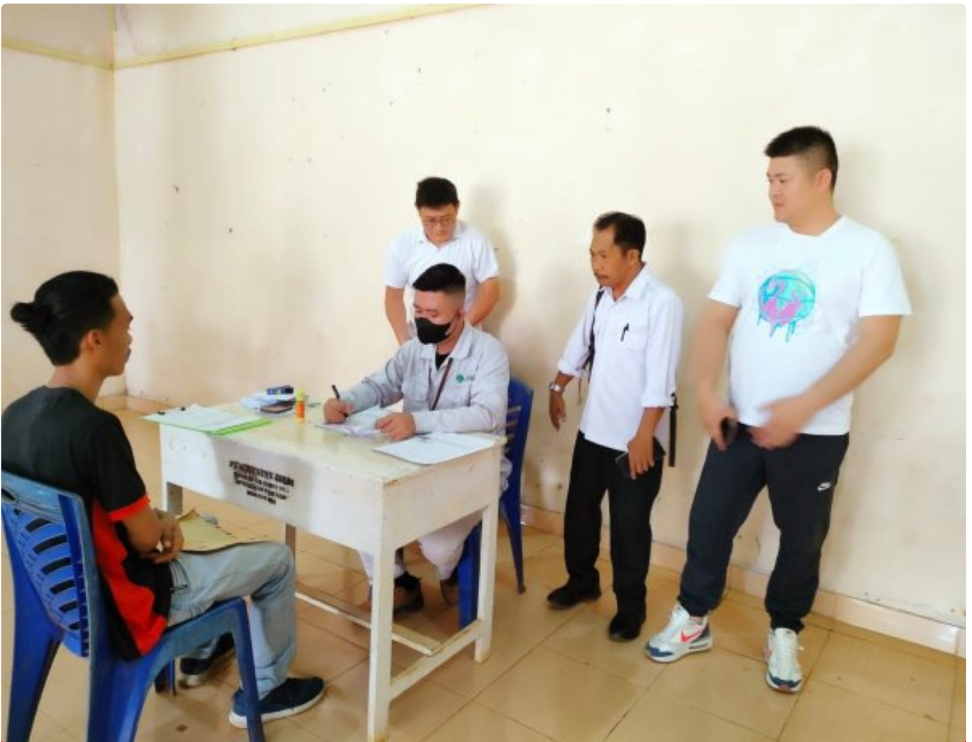
Tampak salah satu calon tenaga kerja PT GNI sedang proses rekrutmen di Desa Towara

TOWARA, Morut Sulteng- PT Gunbuster Nickel Industry (GNI) kembali menggelar Job Fair atau perekrutan secara langsung tenaga kerja lokal di Desa Towara, Kecamatan Petasia Timur, Kabupaten Morowali Utara, Propinsi Sulawesi Tengah, Kamis (23/03/2023).